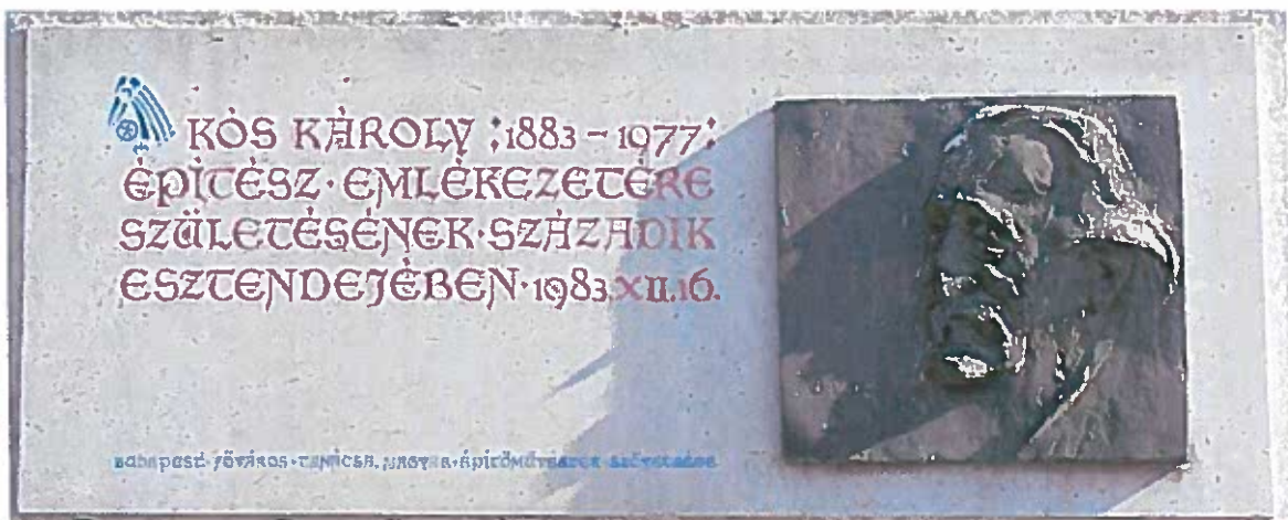
Kós Károly emléktáblája Budapesten