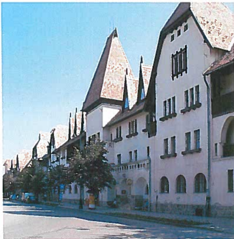
A Wekerletelep és a Kós Károly tér, Budapest