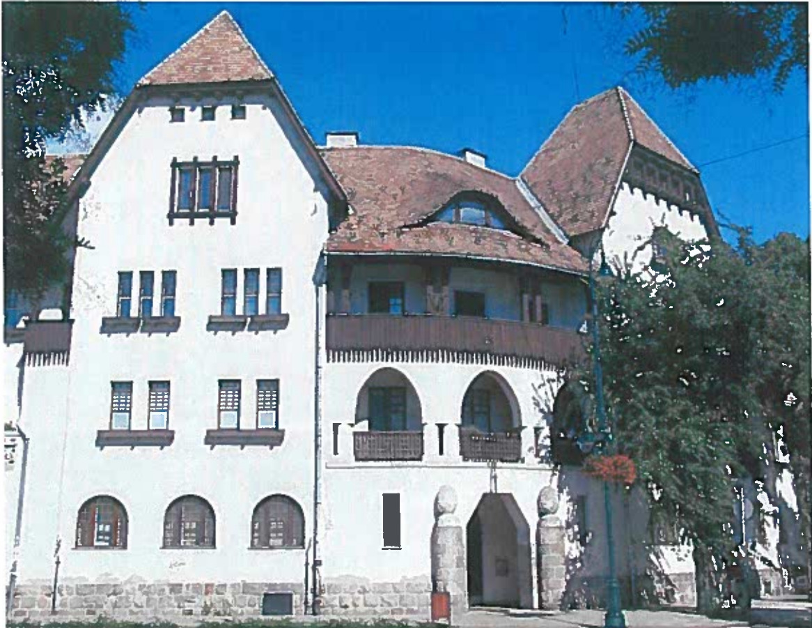
A Kós Károly által tervezett Wekerletelep, Budapest