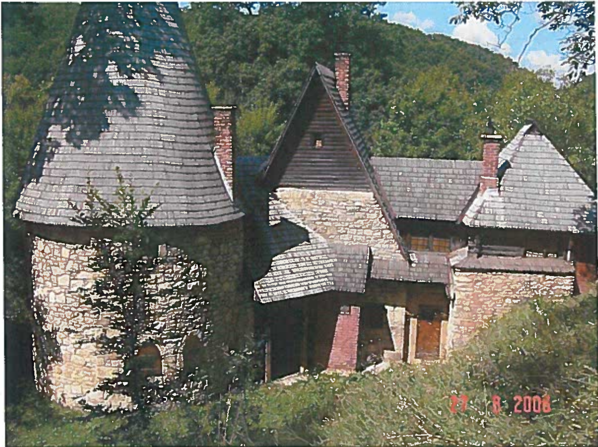
Kós Károly Varjúvára, Sztána