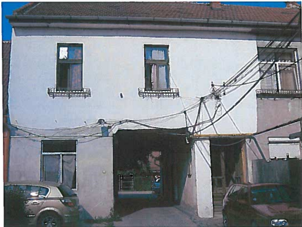
Kós Károly szülőháza, Temesvár